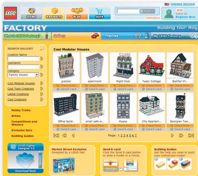
Freier Lauf für die Fantasie: Auf der Internet-Plattform Lego-Factory können die Fans der kleinen Bausteine Modelle entwickeln und dem Publikum vorstellen. So werden Trends sichtbar.

munity zu schaffen, müssen freilich bestimmte Voraussetzungen gegeben sein: Es bedarf eines hinreichend großen, involvierten Kundenstamms und einer geeigneten Plattform für die Kommunikation.